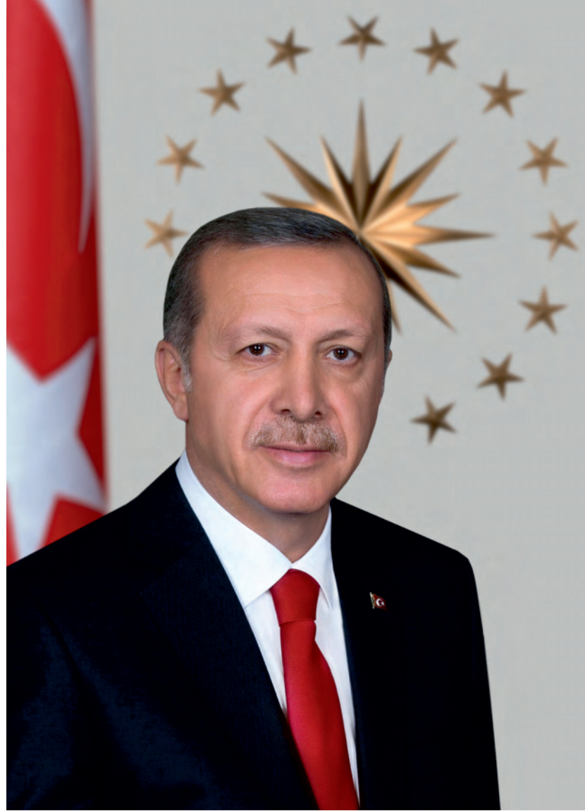
Recep Tayyip ERDOĞAN Cumhurbaşkanı