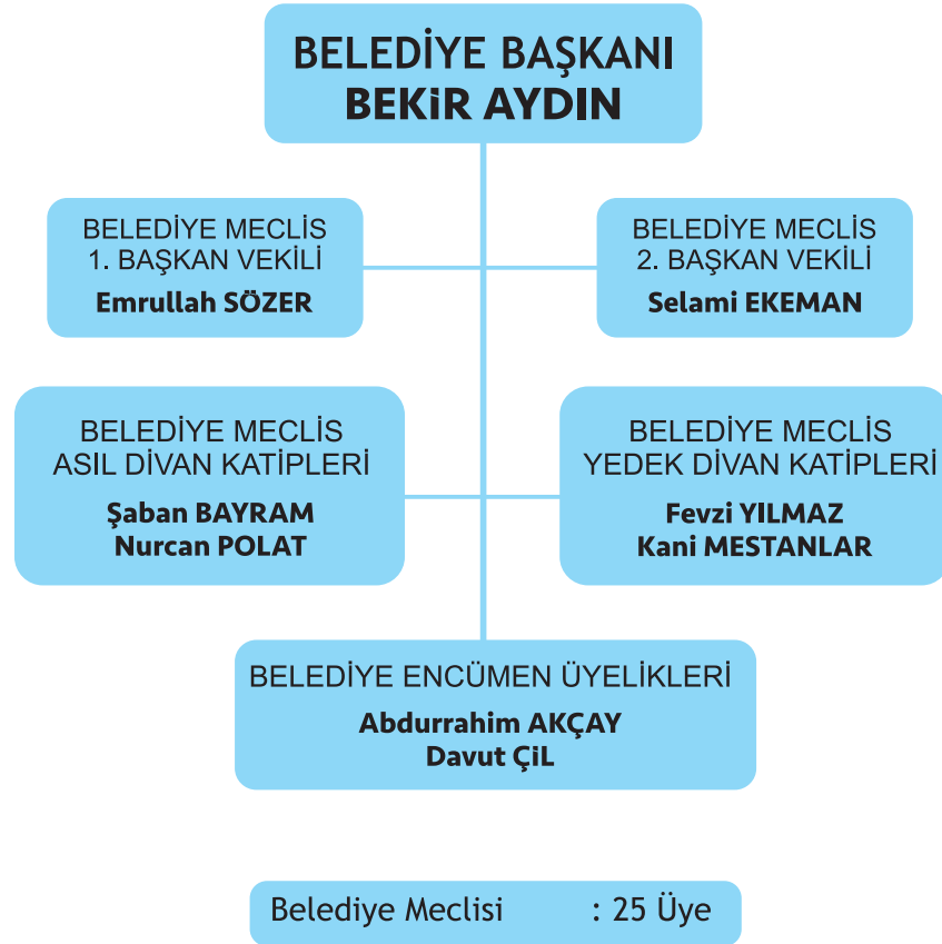
Şekil:1 Belediye Meclis Yapılanması