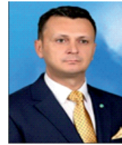
Aziz VURAL İYİ PARTİ